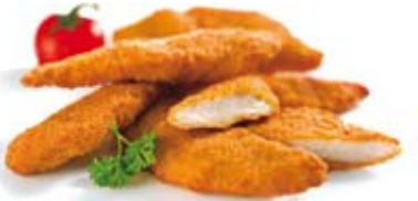
Original 3er/6er Kik 4,95/5,95 € Drei / Sechs knusprig gebackene Hähnchenbruststücke mit Pommes frites und Dip nach Wahl