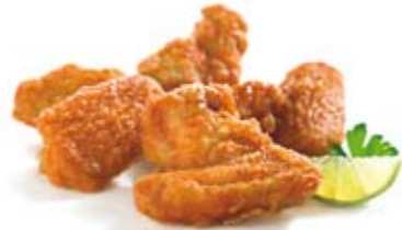
Wings in Knusperpanade 5,95 € Knusprig panierte Chicken Wings mit Pommes frites und Dip nach Wahl