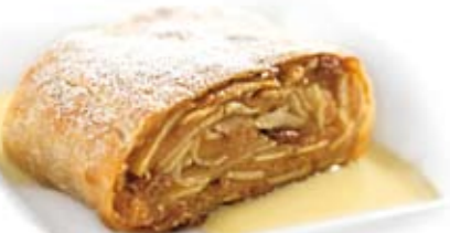
Apfelstrudel 3,55 € mit Vanillesauce