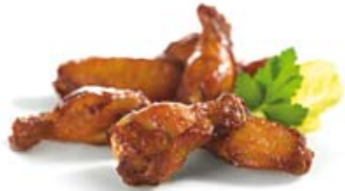
Chicken Wings "klassisch" 5,95 € Pikant gewürzte und gegrillte Chicken Wings mit Pommes frites und Dip nach Wahl