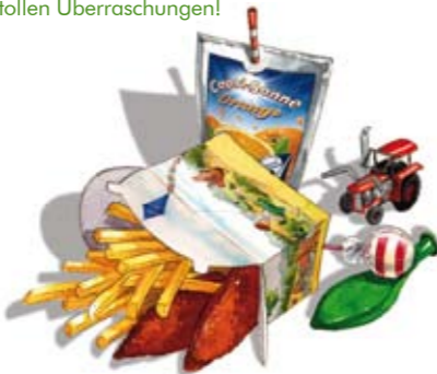
Kinderkiste 3,25 € mit zwei Kiks, Pommes frites mit Ketchup einer Capri-Sonne und tollen Überraschungen!