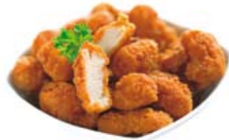
Chicken Pop Corn Box 5,95 € Knusprig panierte Hähnchen- bruststückchen 1 mit Pommes frites und Dip nach Wahl