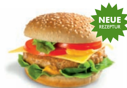
WIENERWALD CHICKEN BURGER