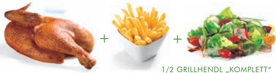
1/2 GRILLHENDL „KOMPLETT“

Backhendl „Wiener Art“ 6,50 € 1/2 Hendl paniert und goldbraun gebacken, in vier Teilen (ca. 20 Min. Zubereitungszeit)