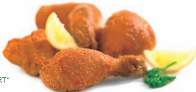
BACKHENDL „WIENER ART“

Ausgelöstes und frisch angebratenes Hendlfleisch, pikant gewürzt, mit Pommes frites und Krautsalat, dazu ein Knoblauch-Dip 3