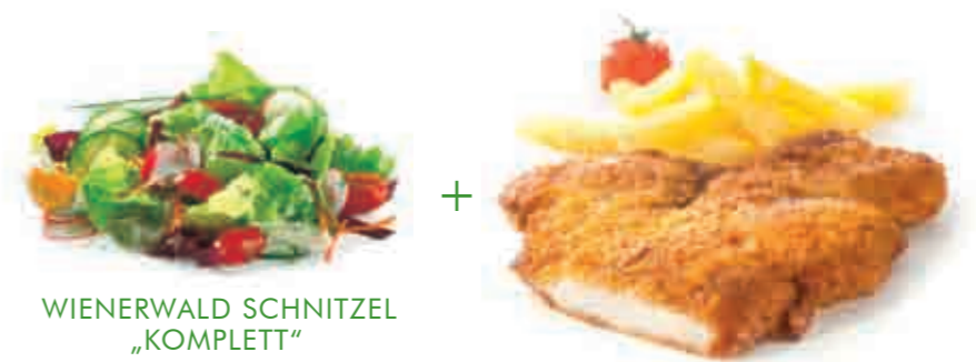
WIENERWALD SCHNITZEL „KOMPLETT“