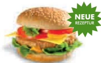
WIENERWALD CHICKEN BURGER