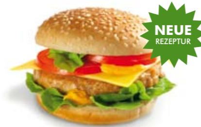
WIENERWALD CHICKEN BURGER

Veggie Burger 3,25 € NEU Herzhaftes Gemüselaibchen im Sesambrötchen