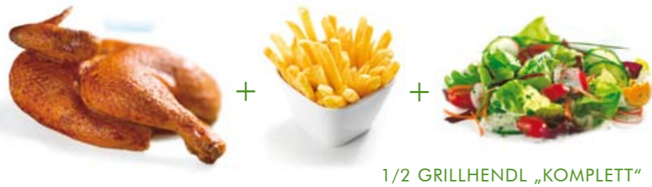
1/2 GRILLHENDL „KOMPLETT“

1/2 Grillhendl „Komplett“ 7,55 € Mit Pommes frites und gemischtem Salat