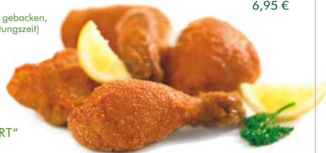
BACKHENDL „WIENER ART“

Backhendl „Wiener Art“ 6,95 € 1/2 Hendl paniert und goldbraun gebacken, in vier Teilen (ca. 20 Min. Zubereitungszeit)